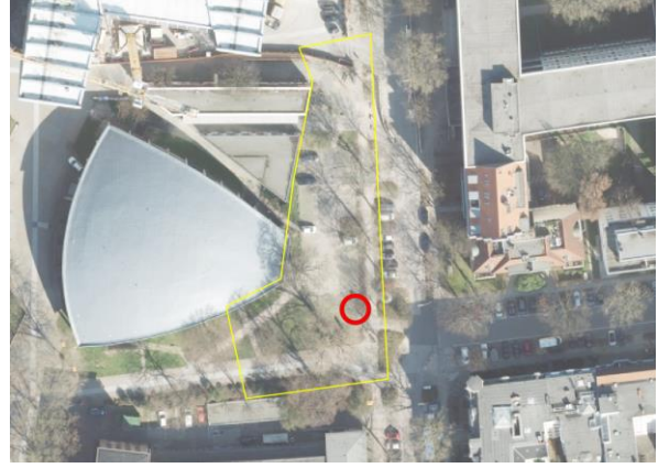
Abbildung 4: Notausgang 1 (rot) zwischen Dammtor I und Schlump I mit BE-Fläche (gelb). 1