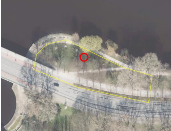
Abbildung 3: Notausgang (rot) zwischen Hauptbahnhof und Dammtor I mit BE-Fläche (gelb). 1

Die Bauweise der Notausgänge 1-3 und 5 ist „Schacht mit überschrittenen Bohrpfehlen“. Die Bauweise des Notausgangs 4 ist „Betonbauwerk in Strecke mit offener Bauweise“.