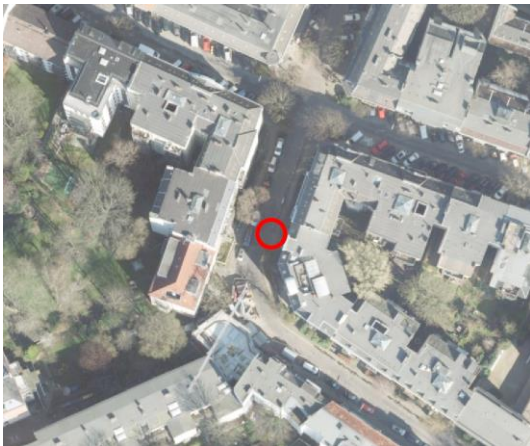
Abbildung 5: Notausgang 2 (rot) zwischen Dammtor I und Schlump I. 1