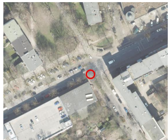
Abbildung 6: Notausgang 1 (rot) zwischen Schlump I und Holstenstraße I. 1