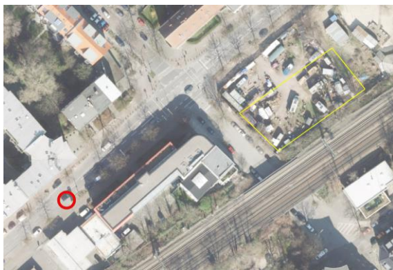
Abbildung 7: Notausgang 2 (rot) zwischen Schlump I und Holstenstraße I mit BE-Fläche (gelb). 1